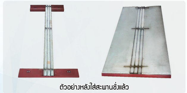
ตัวอย่างหลังใส่สะพานชั่งแล้ว