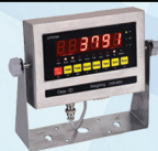
หัวอ่าน รุ่น TAN